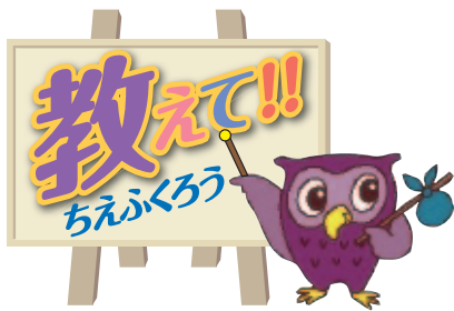
「ちえふうろう」は、市民・消費生活相談室のイメージキャラクターです。