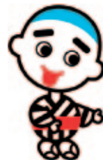
四日市市のゆるキャラ® 「こにゅうどうくん」

下のQRコードを読み取って、オリジナルアプリ「まるごと四日市」のサイトにアクセスしてね！今回は、「宮妻峡」を紹介するよ！