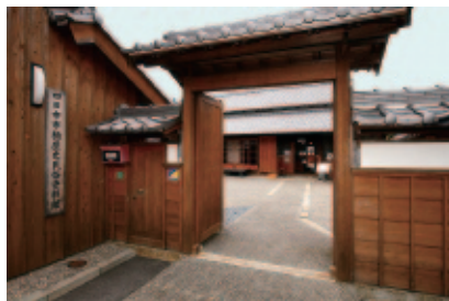
資料館 (岡田邸) 入口

当資料館は、楠地域の歴史および文化の保存と、地域文化の振興を図ることを目的としています。館内には、5,000点以上の資料を収蔵し、そのうち約600点を展示しています。