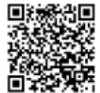
「まるごと四日市」 のサイト

●「まるごと四日市」のサイトの広報紙のメニューを起動して、この「こにゅうどうくん」のイラストや表紙の「広報よっかいち」のロゴにスマートフォンをかざせば動画が見られます ※利用には無料アプリ「junaio」のインストールが必要