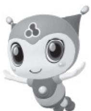
マスコットキャラクター「ココロくん」

LPガスと太陽光発電など、複数のエネルギーを有効に組み合わせ、エコと快適を両立したライフスタイルを提案します。