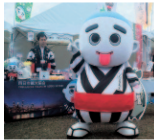
決戦投票会場でのこにゅうどうくん(浜松市)

ご協力いただいた皆様から感謝申し上げ、次回はさらに上位を目指そうと決意を新たにしております。