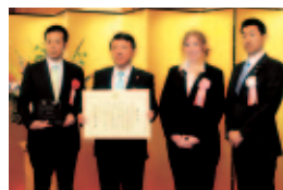
総務大臣賞を授与された市長(左から2人目)

特に、小中学校での英語指導員の受け入れ(通算約90名)や交換学生・教師の相互派遣事業、本市とロングビーチ市・天津市の高校生による「地球環境塾」などは特徴的な事業であり、今後も継続して実施しながら、都市間交流の充実を図っていきたいと考えています。