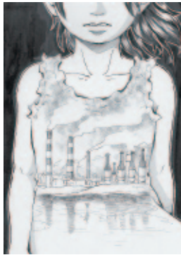
作成中の四日市公害の漫画「ソラノイトー少女をおそった灰色の空」

私の好きな地元四日市の今の自然は、公害裁判をはじめ、さまざまな人々の努力の上に成り立っており、あって当たり前ものではありません。このことを意識せずに暮らしていたら、今の自然を持続していけないのではと感じ、次世代の子どもたちにも今の風景を見せてあげたいと思いました。「いつか四日市公害の漫画を描きたい」という気持ちがありましたが、公害の重みを考えると、簡単には描けないし、失礼に当たるのではないかとも思っていました。でも、当時を経験した人たちは高齢化していますし、その人た