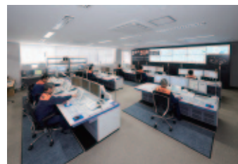
三重北消防指令センターの様子

また、大規模災害時などには、各自治体が迅速、的確に連携する広域防災体制の強化にもつながるものと期待しています。