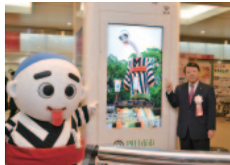
ふれあいモールに設置した デジタルサイネージ

デジタルサイネージは、市政情報や防災情報、さらには、四日市の魅力や観光・イベント情報を発信する設備であり、一方、Wi-Fiは、スマホなどからインターネットを利用し、本市の発信する様々な情報を受信できるツールです。