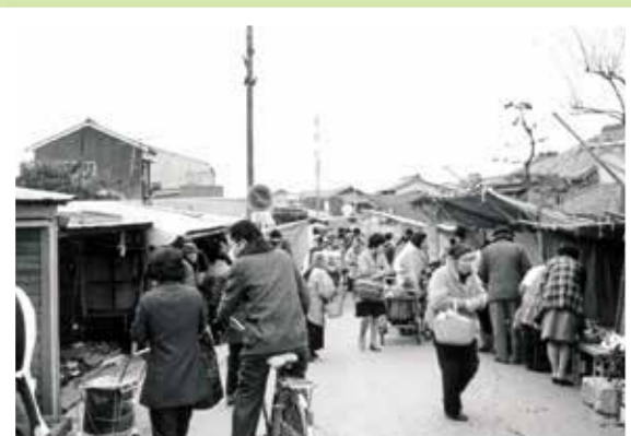
昭和50年ごろの市場の様子（三滝川慈善橋）

弘治・永祿（1555～1570年）のころになると市場も整い、四日市と称して毎月四の付く日（4日、14日、24日）の定期市が始まりました。これが四日市の名の起源であるといわれています。