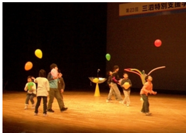
<平成21年度 三河特別支援学級学習発表会>