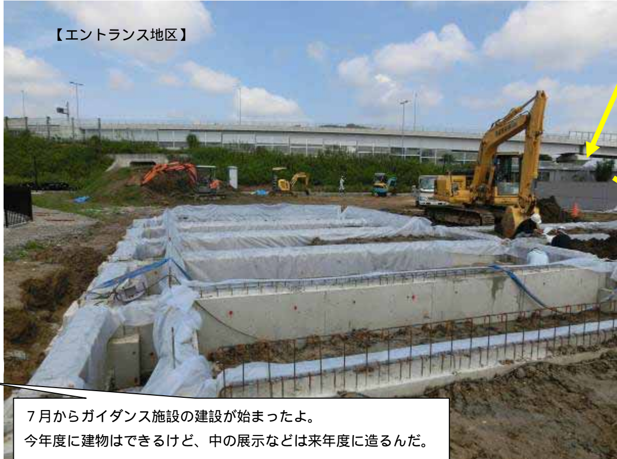
【エントランス地区】

7月からガイダンス施設の建設が始まったよ。 今年度に建物はできるけど、中の展示などは来年度に造るんだ。