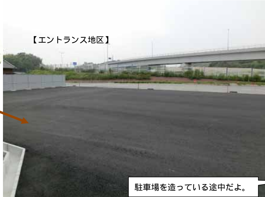
【エントランス地区】