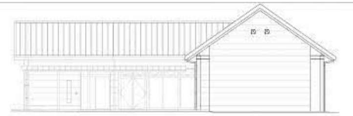
ガイダンス施設正面外観図 (北西から)

7月からガイダンス施設の建設が始まったよ。 今年度に建物はできるけど、中の展示などは来年度に造るんだ。