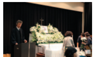
“お葬式のシーンかな？”