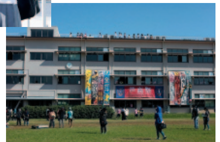
“学園祭のシーンではエキストラ190人！”

問い合わせ先 観光・シティプロモーション課 (☎354-8286 FAX354-8307)