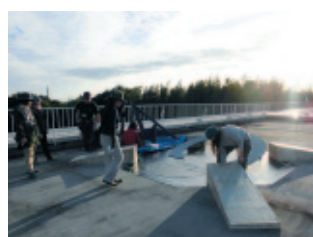
“屋上に大きな日時計のセットを作っているよ”