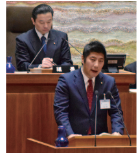
就任後初の議会で所信表明する森市長