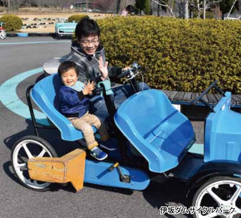
伊坂ダムサイクルパーク