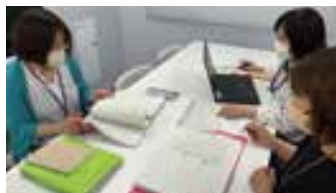
▲先生や生徒の皆さんの配膳の仕方や喫食量を見て次の献立に活かします

学校給食の献立を考えたり、児童・生徒の皆さんへ食べ物や食べ方・栄養について指導を行ったりします。私たちは4月に新しくできたばかりの「四日市市学校給食センター」で、中学校給食を担当しています。給食の献立を考えること以外にも、食材の品質チェックや調理状況の確認をしたり、給食の時間にはそれぞれ担当の中学校に行き、配膳や食事の様子を見ながら生徒の皆さんや先生のご感想や意見を聞いて次の献立を考えたりしています。 ※喫食量とは…全量のうち、食べている量のこと。