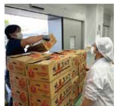
▲荷受け作業をしている様子

給食は生きた教材です。栄養バランスの取れた食事は給食が教えてくれます。他にも社会や理科、国語などの授業にも関係しているんです。今日の給食で使われている食材の産地はどこか、日本地図でわかるかな?など、給食が皆さんの学びにもつながるように考えています。ぜひ献立表や給食日よりなどを読んでみてくださいね。