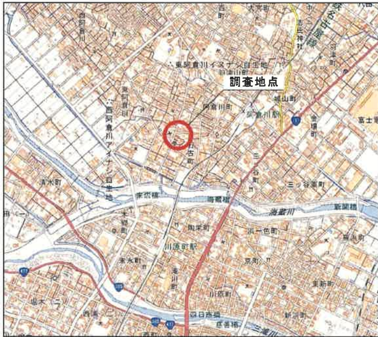
国土地理院発行数値地図 10000 に加筆