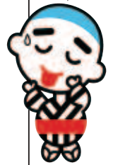
交通規制「ゾーン30について」(三重県警察)より