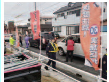
啓発活動(3月9日 羽津地区)

「ゾーン30」の実施エリアについては、市ホームページ(HP)ID1001000001914)に掲載していますので、ぜひご覧ください。