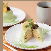
かぶせ茶の とろとろ クリーム パンケーキ 単品 ¥1,000 (税込)