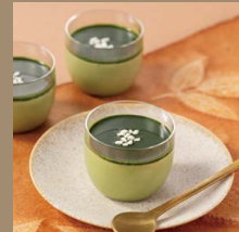
かぶせ茶の なめらか 抹茶プリン 単品 ¥400 (税込)