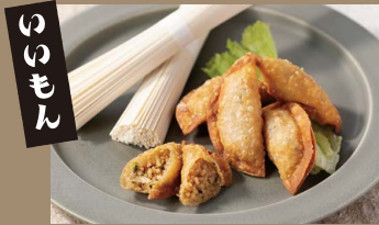
MuSuBu バージョン 四日市 ひやむぎ餃子 5個入り ¥500 (税込)

「四日市農芸高校の生徒さんが開発」 地元の食の魅力を発信したい！と、名産品の「ひやむぎ」を 使った地元高校生考案のレシピを MuSuBu 流にアレンジ！