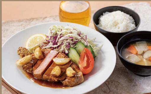
四日市ど当地グルメ「とんてき」プレート ドリンク付 ----- ¥1,650 (税込) 【セット内容】・とんてき・白米・四日市野菜の味噌汁