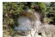
密閉された「山の工場」の入口(泊山小学校北)