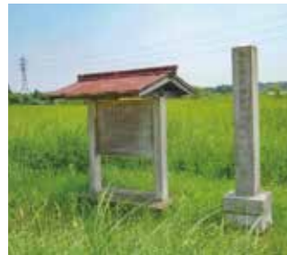
御池沼沢植物群落

市内の丘陵地には600万年前から100万年前まで存在した東海湖(東海湖盆)に由来する湿地が多くあります。湿地には東海地方の固有種が多数生育しています。