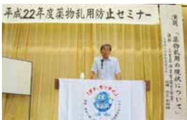
警察官時代に講師として登壇

薬物使用者を助けられるのは、親族や隣人、周りの人たちの愛情です。愛なくしては百パーセント立ち直れません。薬物から身を守るのは社会の力です。そのためにも薬物問題について関心を持ってもらいたいのです。私は、今後も優しさを持って人の心に寄り添い、地道な活動を続けたいと思います。