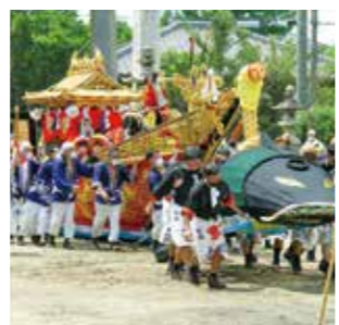
鳥出神社の鯨船行事

北勢地方に現存する陸上の模擬捕鯨行事です。鯨を豊饒の象徴とみなし、これを仕留める演技を行うことによって、大漁や豊饒を祈願するこの地域に伝承する行事です。