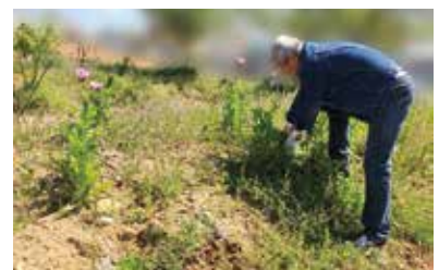
麻薬成分を含む「ケン」の抜去

11月放送のCTY-FM「よっかいち わいわい人探訪」でも紹介します。(放送時間は裏表紙へ)