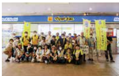
薬物乱用防止を街頭で啓発する指導員たち