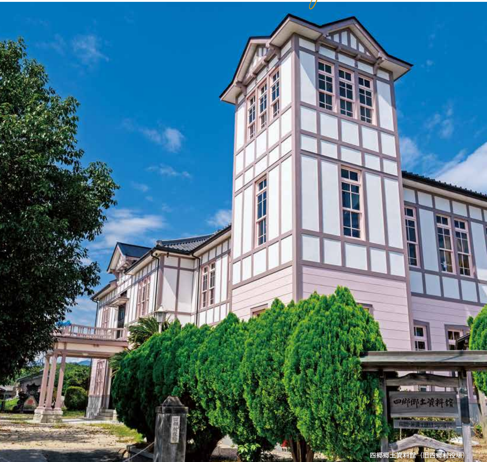
四郷郷土資料館 (旧四郷村役場)

02 【特集】 守り、活かし、次代へ 私たちのまちの文化財 08 もっと知りたい糖尿病 09 子育て家庭を応援します！