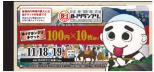
「2023東海・北陸B-1グランプリin四日市」イベントチケット

販売場所は市役所観光交流課内の実行委員会事務局、四日市観光協会窓口、近鉄の主要駅営業窓口、B-1グランプリチケット販売専用ページです。詳しくはB-1グランプリ公式ホームページをご覧ください。