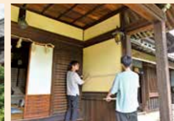
調査に参加する学生たち