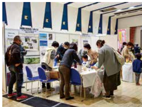
昨年度の四日市市環境フェア

会場でのさまざまな発表や体験を通じて、本市の環境の取り組みについて楽しく学び、身の回りの環境問題などを改めて考えるきっかけにしてはいかげでしょうか。