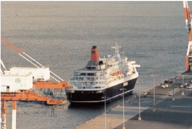
「にっぽん丸 四日市港 寄港(平成23年12月)」