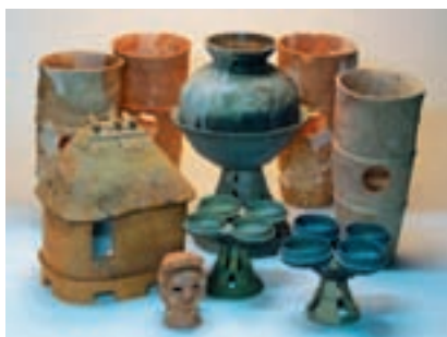
1号墳から出土した須恵器・埴輪 手前右2つが台付四連杯

の発見です。また、装飾須恵器の台付四連杯(筒状の脚台に4個の杯を連結したものは、三重県でも2例しかない非常に珍しいもので、いずれも祭祀に用いられたものと考えられます。