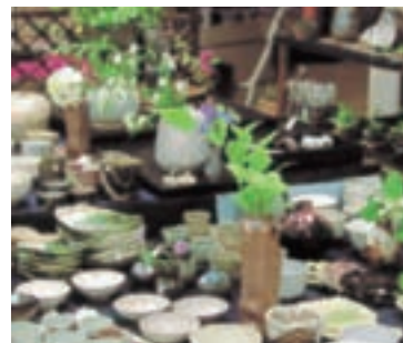
食器や花瓶など個性豊かな作品が並びます

陶芸教室に通っている人たちの作品もそれぞれ個性があり、とても面白いです。5月に行われる萬古まつりでは、これらの作品を展示販売もしているので、皆さんも一度見に来てください。