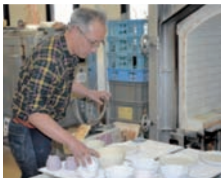
世界に一つしかないものばかりなので慎重に作業を進めます

最近では、幼稚園や学校などでも絵付け体験をしている所があるので、子どもから大人までたくさんの人にモノづくりの楽しさを広めていきたいと思っています。