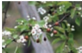
イヌナシの実と花