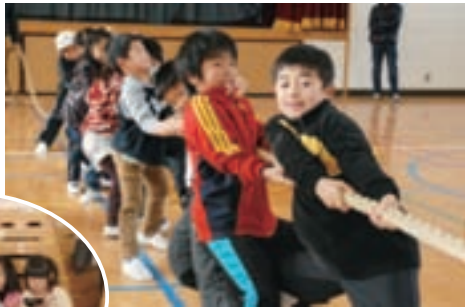
第28回綱引き大会 (1月26日 下野地区)

小学生の部5チーム、一般の部3チームの参加があり、それぞれで総当たり戦を行いました。心一つにして力を合わせて熱戦を繰り広げた結果、子どもの部は「山城町」が、一般の部は「あさけが丘一丁目」が優勝しました。全対戦終了後は、体育委員さん手作りのおいしいぜんざいで温まりました。