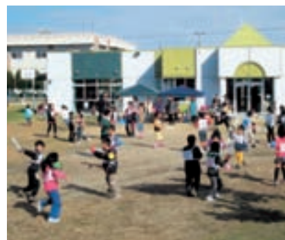
北部児童館の様子