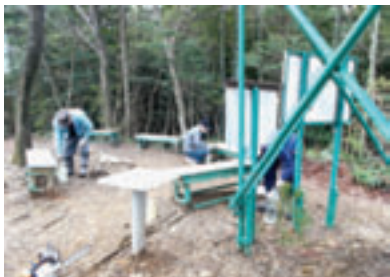
のろし 檜 付近の整備

大門山周辺の生活道を「かわしま里山を愛する会」の皆さんが散策路として整備し、地域住民から親しまれています。大門山は大正時代、大阪の米相場を東京に知らせるために、中継点の桑名・名古屋への取り次ぎをする「のろし場」として活用され、煙の色によって米相場の動きを知らせていたと言われています。