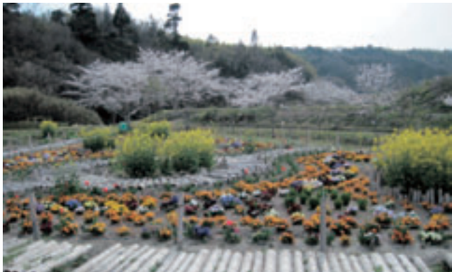
バイオガーデンと千本桜

バイオガーデンは昨年、「川島地区連合自治会」、「西部自治会バイオガーデンクラブ」の皆さんが中心となって力を合わせて整備しました。小型耕運機などで土地をならし、近くの竹林から竹を伐採加工して歩道に敷いたり、周囲の柵などを作ったりしました。雪の日に作業を行ったこともあり、昨年4月に花の植え込みが終わり、完成しました。