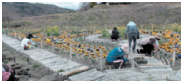
バイオガーデンの整備風景

近隣の県指定天然記念物の「川島町のシデコブシ群落」とビオトープ、それに鹿化川の千本桜が加わることで、点から線の散策ルートになることを願って、日々ボランティアの人たちは整備に汗を流しています。