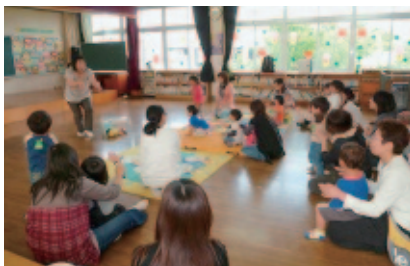
「あそぼう会」の様子

同時に、子育ての悩みやお子さんの発育などの育児相談も行っており、参加された人たちから「行ってみたいら、ゆっくり子どもと向きあえた」