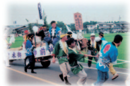
平成6年のお木曳き

この「お木曳き」は約400年の歴史があり、そろいのはんてんを着た町民が引き綱を手に手に持って並び、華やかで威勢のいい行列になります。全員で木遣り節に合わせて大声で掛け声をかけて町内を練り歩き、神社の石段を台車ごと引き上げる様子は勇ましく、見物の人も思わず声が出るほどです。