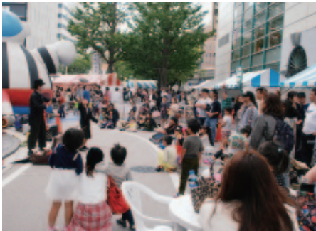
よっかいちYYストリート (10月12日 近鉄四日市駅周辺)

晴天に恵まれ、恒例の歩行者天国が開催されました。人気パン店による「パンマルシェ」、地元店のスイーツブース、防災啓発コーナーなど充実した内容で、毎回人気のミニSLコーナーとふわふわこにゅうどうくんには、ずっと子どもたちが列を作っていました。