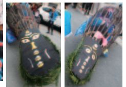
南楠の鯨船まつり (10月10・11日)

市の無形民俗文化財に指定されている鯨船行事が開催されました。南楠の鯨船には、女子中学生が担当する姫鯨も登場します。鯨や龍神丸を操る人、船の漕ぎ手や踊り子の子どもたちなど、総勢200人以上の人が2日間練り歩き、多くの皆さんとともに地域全体が一つになっていました。下記の「広報紙で動画を見よう」から、当日の様子を動画で見られます。