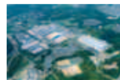
東芝四日市工場 (山之色町)

共同運営するウエスタン・デジタル社と合わせて1兆円超とも報道されている今回の設備投資が、雇用の増(900人増の予定)や税収の増に加えて、地域経済の活性化につながることを確信しています。