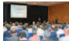
総合戦略の概要について説明する田中市長