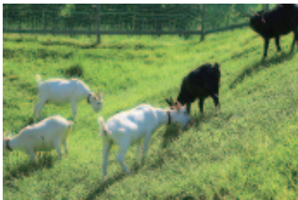
10月は、金・土・日曜りと祝日に放牧予定。詳しくは、市街地整備・公園課(☎354-8197)へ

小動物園は、年間を通して入場無料。ヤギのほかにもヒツジやヤクシカ、ウサギ、モルモット、クジャクなど、かわいい動物たちが迎えてくれますよ。