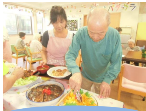
おばんざいの様子

レクリエーションや四季折々の行事に参加し、他には散歩、買い物、花見など外出支援も実施しています。