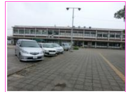
▲陳腐化している舗装