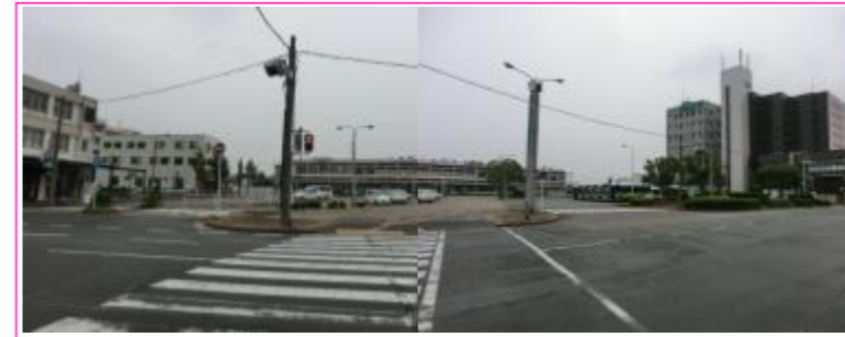
▲駅前広場の出入り口