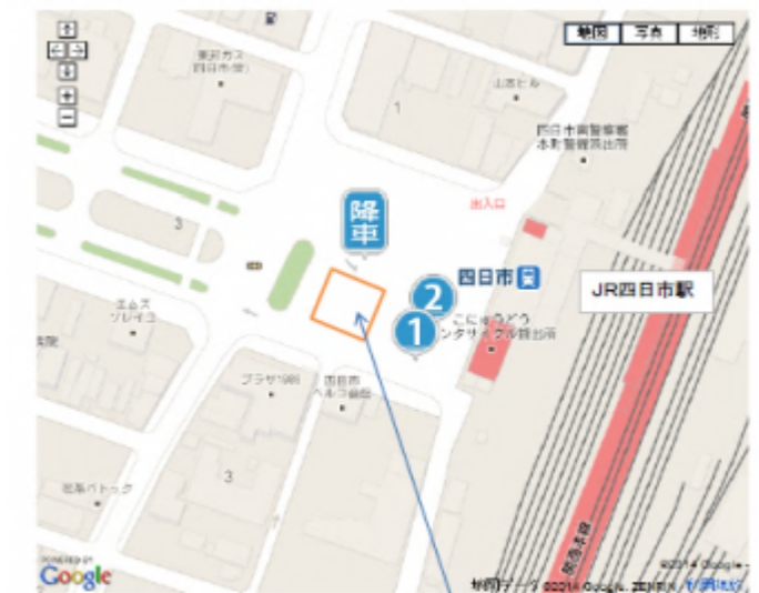
バスプール 三重交通12台 三岐バス 1台