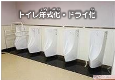
トイレ洋式化・ドライ化