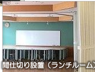
間仕切り設置 (ランチルーム)

ランチルームは、 とくべつしえんきょうしつ 特別支援教室としても つか 使えるよう、間仕切りを せっち 設置しました。