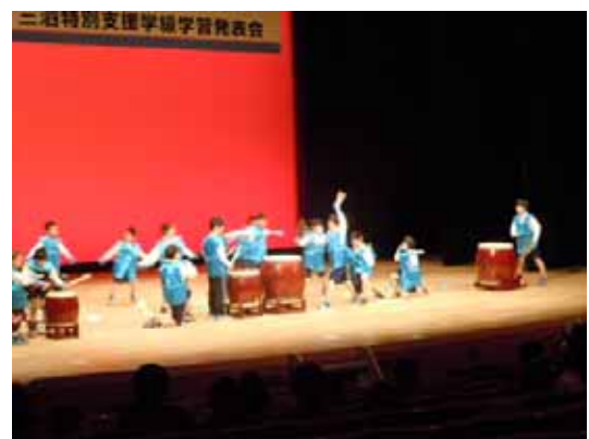
< 平成25年度 三河特別支援学級学習発表会 >