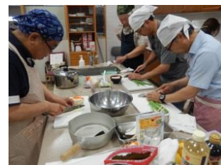
【昨年度の講座の様子】