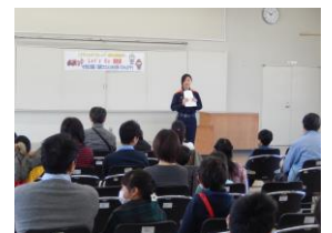
【女性の消防士さんの話】

ちなみに、この時の消防士さんのお話によると、四日市市では、343人中13人の女性の消防士さんが活躍中とのことでした。