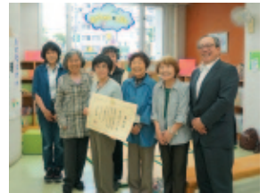
葛西教育長(右)から表彰状の伝達を受けたメンバーの皆さん

これからも活動を長く続けていきたいと、メンバー一同張り切っています。そのためにも、若い人が仲間になってくれるとうれいすね。随時、募集しています。お話を覚えて、子どもたちの前で語るの、頭の体操にもなりますよ。