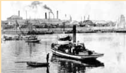
明治末期の 四日市港