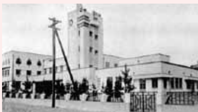
昭和6年に竣工した市の庁舎(浜町)