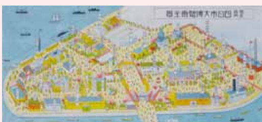
博覧会会場(千歳町)の配置図