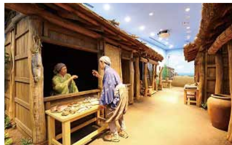
室町時代の定期市の様子(博物館常設展の展示)

こうして歴史をたどると、古くから先人たちがこの地につくってきたにぎわいが、今の四日市市のルーツにあることに気付かされます。