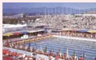
夏季大会の開会式 (中央緑地水泳球技場)