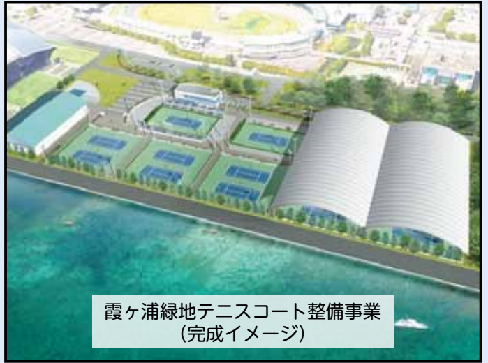
霞ヶ浦緑地テニスコート整備事業 (完成イメージ)