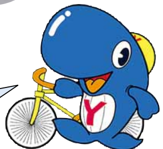
四日市けいりんマスコットキャラクター 「フォーリン」