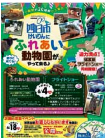
平成 29 年 6 月開催 ふれあい動物園がやってくる♪