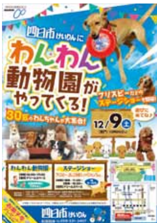
平成 29 年 12 月開催 わんわん動物園がやってくる！