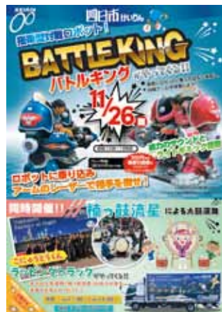
平成 29 年 11 月開催 バトルキングがやってくる！