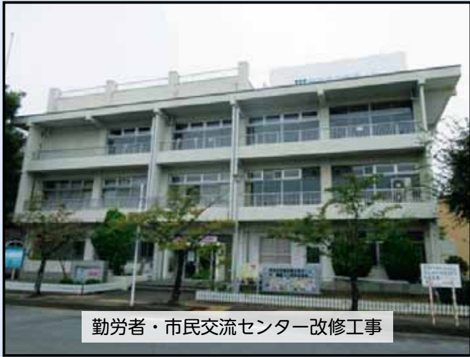
勤労者・市民交流センター改修工事