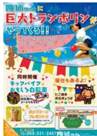
平成 29 年 10 月開催 巨大トランポリンがやってくる！