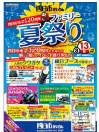
平成 29 年 8 月開催 ファミリー夏祭り