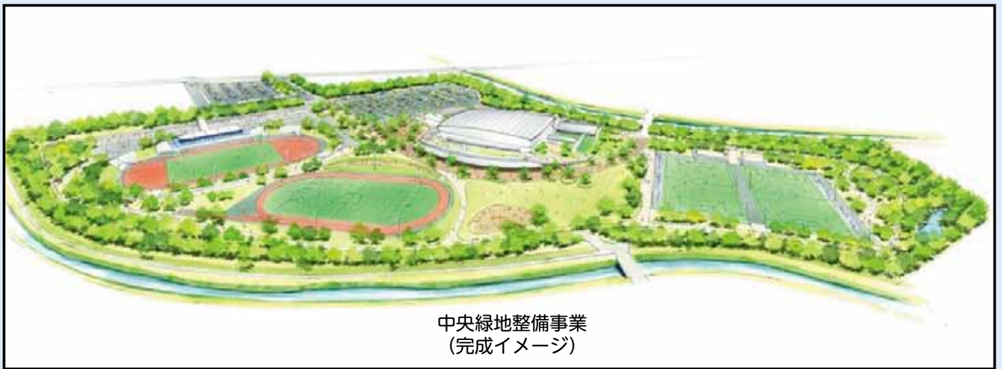
中央緑地整備事業 (完成イメージ)