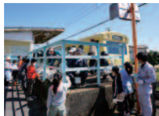
地元の有志と小古曽駅を塗装

これからも仲間とボランティアでつながり、仕事は切磋琢磨して、社会貢献をしていきたいです。本当には、「いつでも塗りにいきますよ」。