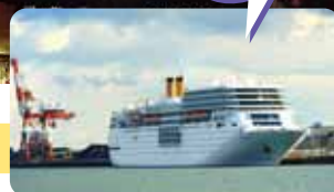
1月2日に寄港したコスタ ネオ ロマンチカ(イタリア船籍)

「飛鳥II」や「にっぽん丸」といった客船が寄港し、歓迎イベントや船内見学会が開催されています。平成30年度は、外国客船の寄港が何度も予定されています。入出港のスケジュールは四日市港客船誘致協議会ホームページ([HP] http://www.yokkaichi-cci.or.jp/cruise/ )をご覧ください。