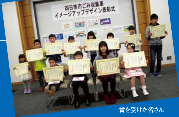
賞を受けた皆さん