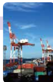
コンテナクレーン

霞ヶ浦地区の北ふ頭にはコンテナ専用岸壁があり、巨大なコンテナクレーンでコンテナを一つずつ持ち上げ、揚げ積みしています。外貿コンテナ取扱個数は増加傾向にあり、平成29年には過去最高を記録しました。