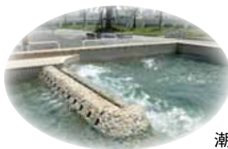
潮吹き防波堤のレプリカ