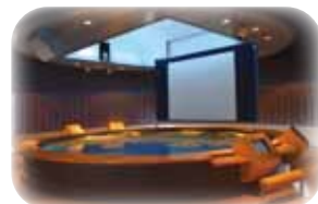
映像で港を紹介するナビゲーションシアター

高さ100メートルと、三重県で一番高い建物です。14階の展望展示室「うみてらす14」からは、360度のパノラマの景観が広がります。快適な室内空間で、コンビナートなどを一望できるベストポジションです。