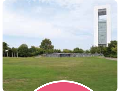
公園の滝(左)と芝生広場(右)