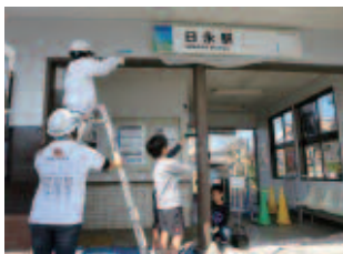
子どもたちと日永駅をきれいに

子どもたちなど、市民も参加することで思い出作りにもなるし、「あすなろう鉄道に乗ってきてね」と促すことで利用促進も行っています。今後も塗装のプロとして、あすなろう鉄道を応援していきたいです。