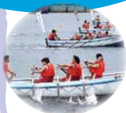
カッターレース大会