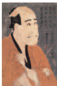
東洲斎写楽 「二代目嵐龍蔵の 金貨石部金吉」

春信、美人画を描いた鳥居清長、喜多川歌麿、役者絵で有名な東洲斎写楽、風景画を確立した葛飾北斎。さらに歌川派の総帥である歌川豊国、その門人で役者絵や美人画に長けた