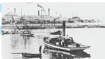
明治末期の四日市港

の2016年積卸港（空港を除く）別貿易額全国11位と、現在では全国有数の港と言えます。