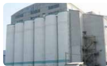
穀物専用のサイロ(第2ふ頭)

千歳地区には、第1・2・3ふ頭と、四日市港発祥の地の旧港があります。ふ頭で扱う貨物は化学薬品、完成自動車、穀物、鉱石など多岐にわたります。