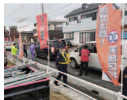
啓発活動(3月9日 羽津地区)

「ゾーン30」の実施エリアについては、市ホームページ(HP)ID1001000001914)に掲載していますので、ぜひご覧ください。