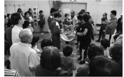
みんなの防災セミナー

ら、地域での人と人との交流による顔の見える関係をつくることで、安全で安心なまちづくりができるのではないのでしょうか。