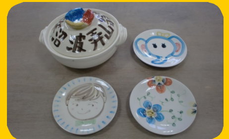
真っ白な萬古焼に絵を描こう!

※ラジオの公開録音中は体験いただけません。 ※お席(8席)が空き次第、随時受付いたします。