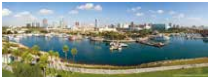
姉妹都市提携締結55周年 本市とロングビーチ市は、昭和

ロングビーチ市は、米国カリフォルニア州にある、人口約47万人のまちです。ウォーターフロントの立地を生かした美しい街並みを持つ観光都市である一方、本市と同じように石油化学産業や重工業産業が発達した工業都市でもあり、全米第2位のコンテナ取扱量を誇る港を擁しています。