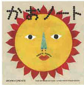
出版社 / ココロS&T