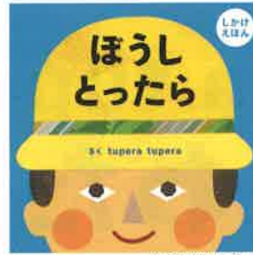
出版社 / 学研プラス