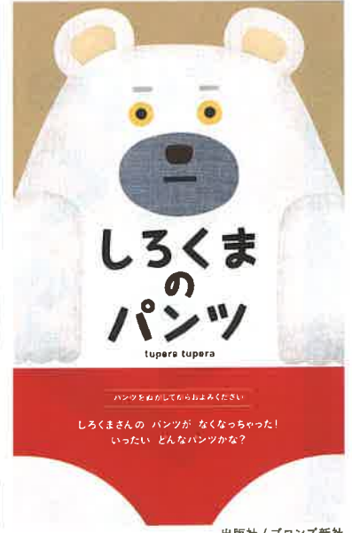
出版社 / ブロンズ新社