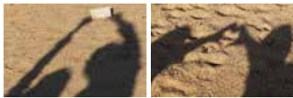
▲手紙を持ってみたり、ハートを作ってみたり、影で分かりやすいポーズを探るのが大変でした

今回は特集が「男女共同参画」なので、男女二人のシルエットを磯津公園近くの海岸で撮影しました。冬の海ということで寒さを覚悟して撮影に向かいましたが、幸い暖かく、春の陽気が感じられる時間でした。波の音が耳に心地よい中、ポーズやカメラ位置を何度も調整し、やっと撮れた一枚です。(服部)