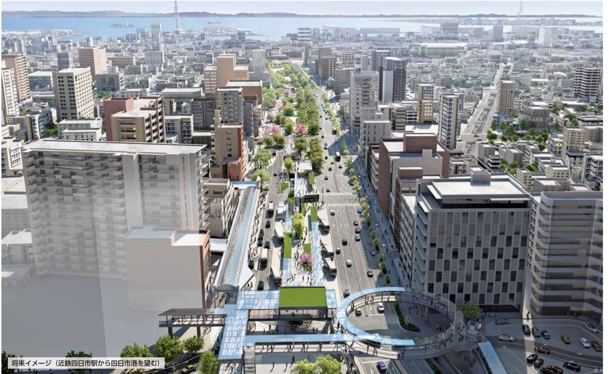
将来イメージ（近鉄四日市駅から四日市港を望む）

近い将来、リニア中央新幹線の東京・名古屋間が開通すると、四日市市は東京から移動時間1時間圏内の都市になります。市ではこのタイミングに合わせて、居心地が良く歩きたくなる魅力的なまちなかを実現するために、中央通りの再編に取り組んでいます。近鉄四日市駅とJR四日市駅の駅前広場を再整備するとともに、近鉄四日市駅の東西には歩行者デッキが設けられ、国が整備するバスやタクシーの乗降場を集約する「バスタ四日市」と直結する計画となっています。さらに、幅員70mの中央通りを1.6kmにわたり歩行者中心の空間として再編するなど、四日市のまちなかが大きく生まれ変わります。いよいよ今年度は、近鉄四日市駅西側の先行整備区間から工事に着手していきます。