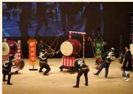
富田石取祭三車連合会(第8回出演)