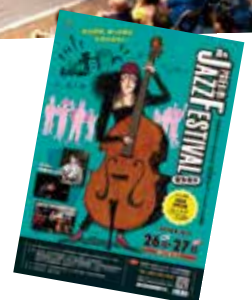
JAZZフェスティバルポスター

私が実行委員長をしているJAZZフェスティバルは、ジャズをはじめいろいろなジャンルの音楽に気軽に触れることができます。散歩をしながら、ぜひ好きなジャンルの音楽を見つけてほしいですね。