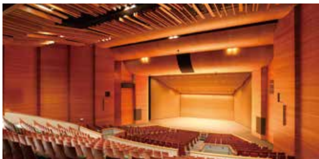
リニューアルした文化会館第2ホール

10月1日、文化会館がリニューアルオープンします。第1・第2ホールなどの吊天井崩落対策を中心に、客席・トイレなどの改修を実施し、より安全かつ便利にご利用いただけるようになります。