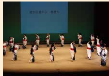
内部地区婦人会(第8回出演)