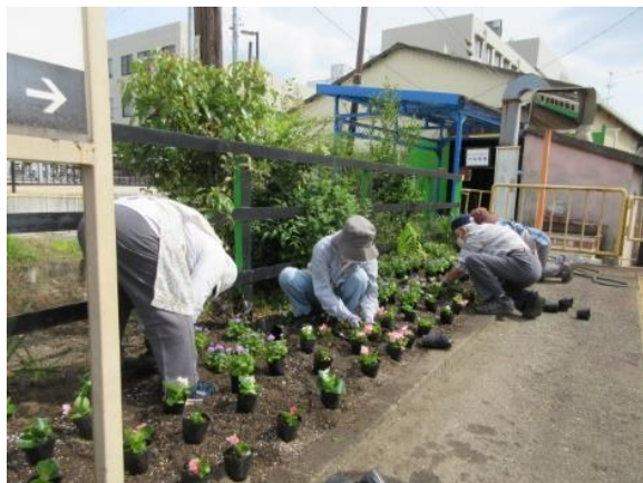
花植え作業の様子（沿線地域の協力）

今後も、地域の皆さまから愛着の持てる身近な鉄道として、安心・安全で信頼できる鉄道であり続けていくため、皆さまのご意見をいただければ幸いです。