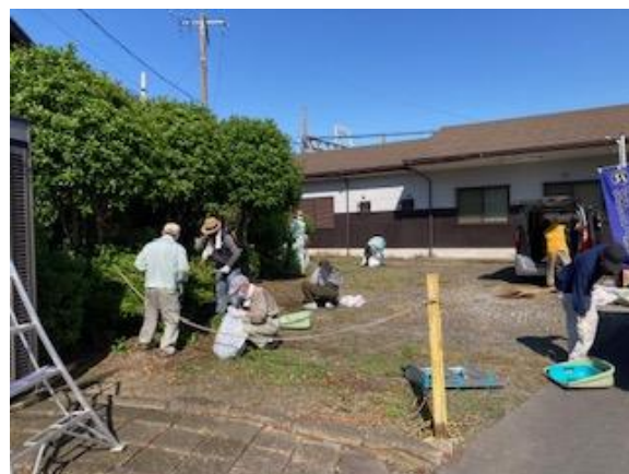
清掃活動の様子（沿線地域の協力）