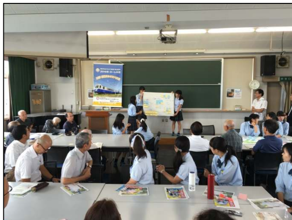
沿線高校・地元・市議会が 連携したあすなろう鉄道についての討論会