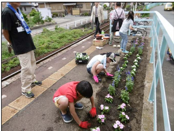
地域ボランティアによる駅の花植え活動

今後も、地域の皆さまから愛着の持てる身近な鉄道として、安心・安全で信頼できる鉄道であり続けていくため、皆さまのご意見をいただければ幸いです。