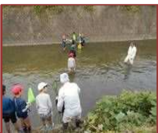
米洗川探検 (羽津北小)