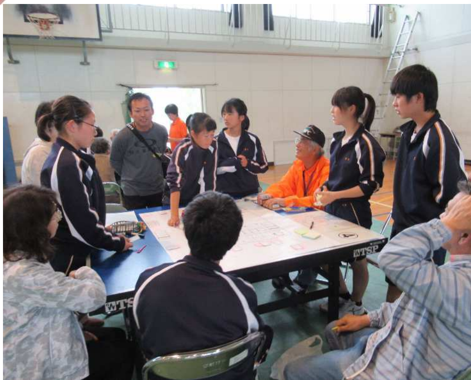
写真:「HUG避難所運営訓練」西朝明中