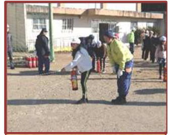
地区合同防災訓練（高花平小）