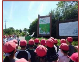
梅林を守る会（泊山小）