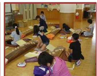
クラブ活動で学ぶ（八郷小）