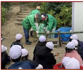
城山保全活動 (三重西小)