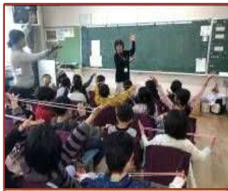
昔遊び交流会 (常磐小)