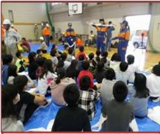
合同防災訓練（四郷小）

子どもたちの安心・安全のため、学習環境の整備や防犯、防災の取り組みを進めています。