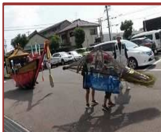
鯨船祭りを学ぶ（楠小）