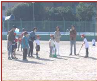
ふれあいグラウンドゴルフ (中部西小)

学校・地域の協働した取り組みを通じて、地域づくりに貢献したり、人とのつながりを深めたりしています。