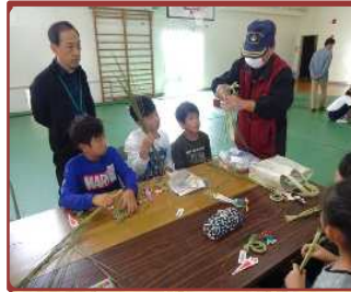
しめ縄づくり（小山田小）