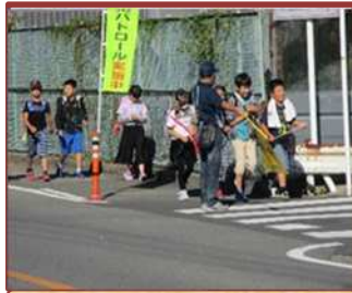
交通安全見守り会（桜台小）