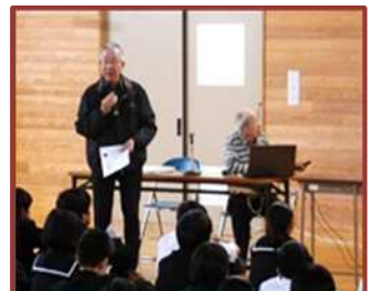
笹川地区郷土学習（笹川中）

クラブ活動や、様々な教科の学習支援を行ってもらうことで、学力や人間力の向上に活かしています