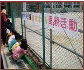
ひまわりプロジェクト (大矢知興譲小)