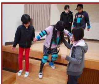
福祉体験学習（橋北小）