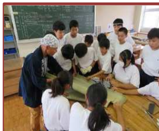
ミニ畳講座（中部中）