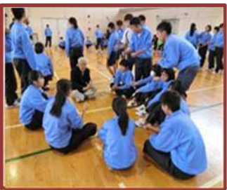
若生会との交流 (山手中)