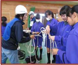
地区総合防災訓練（富洲原中）