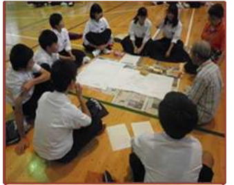
避難所運営訓練（朝明中）