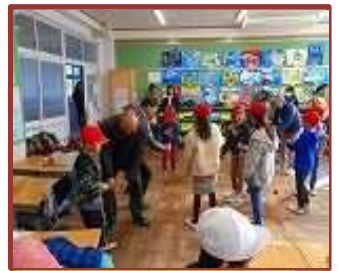
長寿会との交流 (三重小)