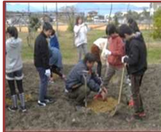
梨づくり体験（下野小）