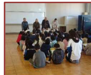
昔の暮らしを学ぶ（桜小）