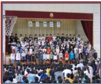
ありがとう集会 (内部小)