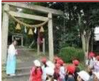
遠保神社で学ぶ（三重北小）