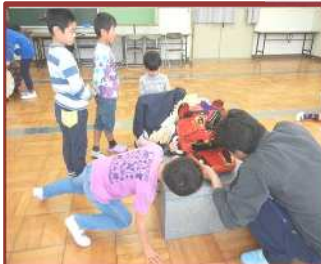
神前の祭りを知ろう（神前小）