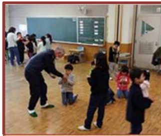
昔遊び体験 (浜田小)