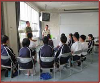
自衛隊と防災訓練（西朝明中）