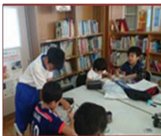
川島子ども未来塾（三滝中）