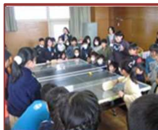
福祉体験学習（川島小）