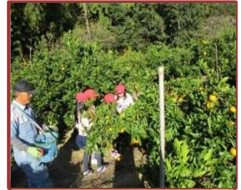
みかん山見学（河原田小）