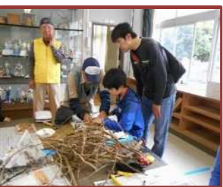
ふれあい祭り (内部東小)