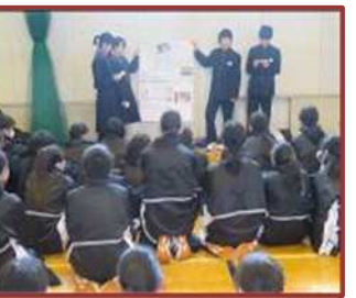
CS 活動学習発表会 (桜中)