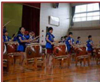
諏訪太鼓の発表（中央小）