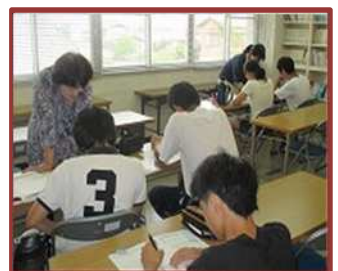
地域子ども教室（大池中）