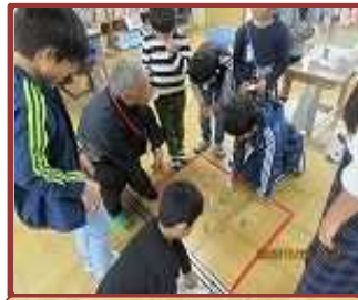
ふれあい集会 (富田小)