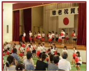
敬老祝賀会への参加 (大谷台小)