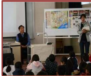
富洲原の歴史を学ぶ（富洲原小）