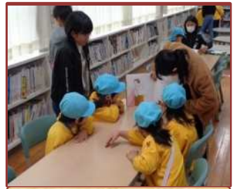
保育園・幼稚園との交流 (日永小)