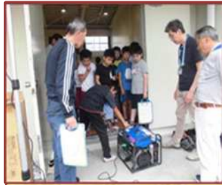
防災教室（常磐西小）