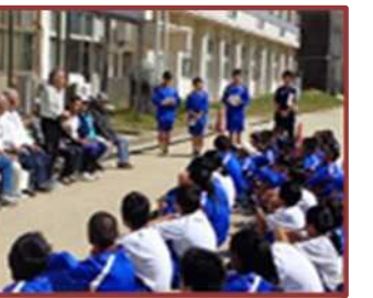
地域の先輩との交流 (楠中)