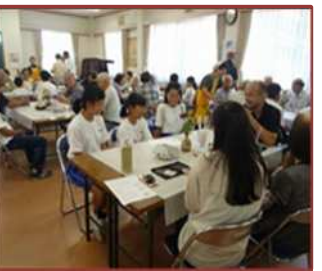
より曾井サロンへの参加 (三重平中)