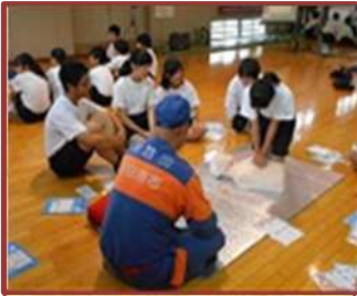
地域防災学習（富田中）