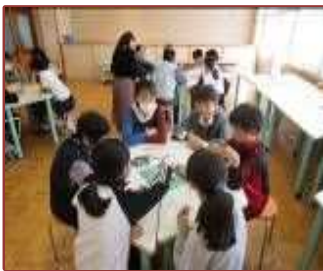
ふれあいランチタイム (八郷西小)