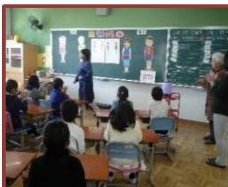
ジェンダーを学ぶ（海蔵小）

クラブ活動や、様々な教科の学習支援を行ってもらうことで、学力や人間力の向上に活かしています