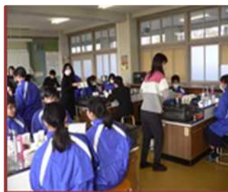
家庭科学習支援（保々中）