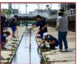
阿瀬知川清掃 (港中)