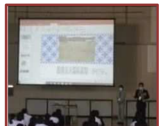
環境保全学習 (大池中)