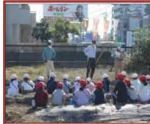
サツマイモ作り（常磐小）