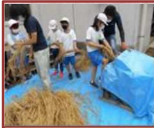
足踏み脱穀機体験（内部小）