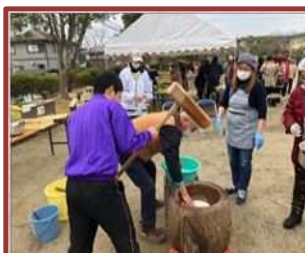
ふれあいどんと祭り (西笹川中)