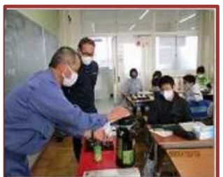
きき茶体験 (水沢小)