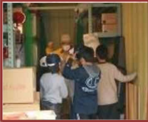
地域の防災教育（三重小）

子どもたちの安心・安全のため、学習環境の整備や防犯、防災の取り組みを進めています。