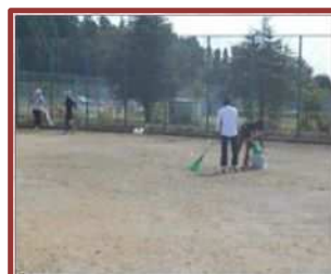
清掃ボランティア (保々中)