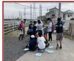
米洗川探検（羽津北小）