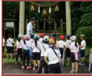
遠保神社で学ぶ (三重北小)