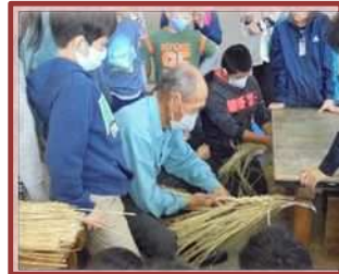
縄づくり体験（下野小）