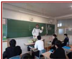
高齢者福祉学習（桜中）