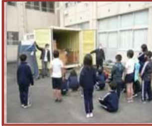
防災教室訓練（大谷台小）