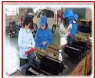
四日市工業高校との交流（日永小）