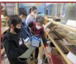
昔の暮らしの学習 (八郷小)