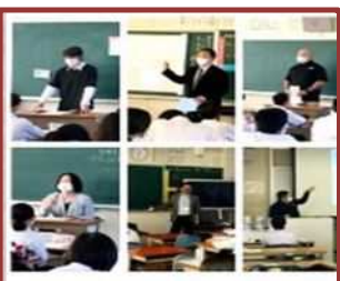
プロフェッショナル（西朝明中）