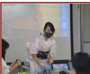
飾り巻き寿司実演（橋北中）