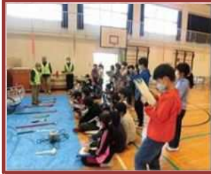
防災教室（常磐西小）