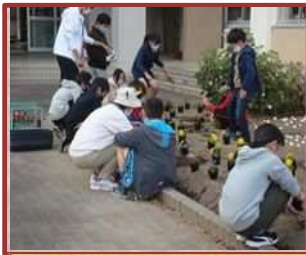
地域連携花壇（桜小）