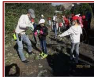
リース作り（内部東小）