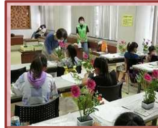
一日先生体験活動（楠小）