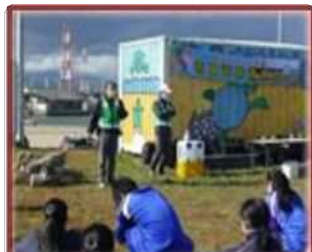
吉崎海岸清掃活動（楠中）