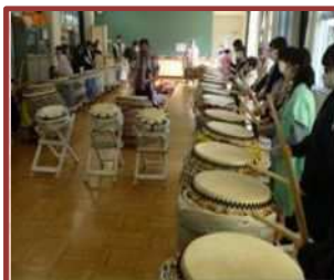
和太鼓クラブ支援 (海蔵小)

クラブ活動や、様々な教科の学習支援を行ってもらうことで、学力や人間力の向上に活かしています