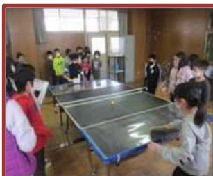
福祉体験学習 (川島小)