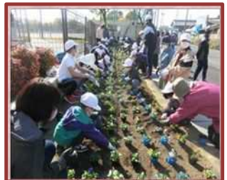
地域連携花壇 (県小)