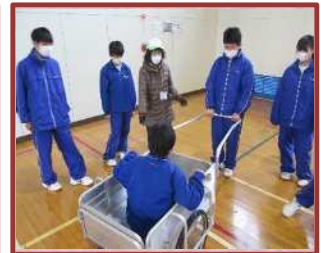
地域子ども教室（三重平中）