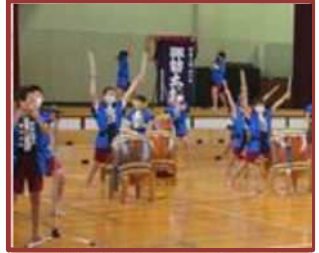
諏訪太鼓の発表 (中央小)