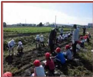
野菜づくり体験 (神前小)