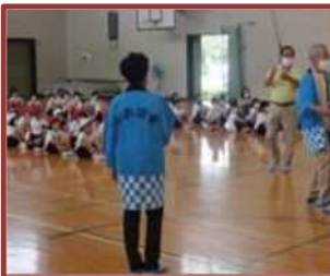
塩浜音頭伝承学習 (塩浜小)