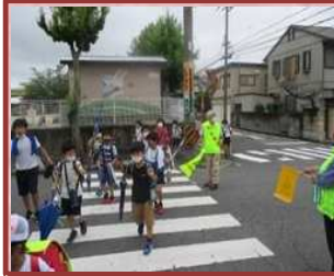
交通安全見守り会（桜台小）