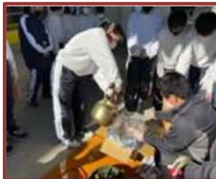
炊き出し訓練（富田中）