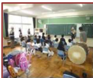
伝統芸能クラブ (四郷小)