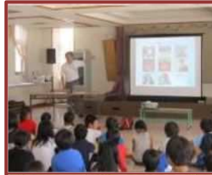
キャリア教育（河原田小）