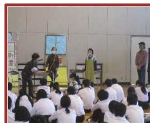
認知症サポート講座 (三滝中)