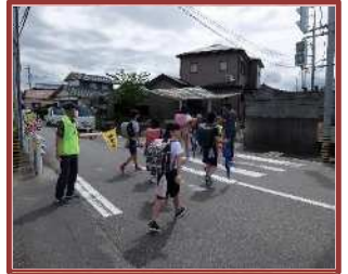
登下校見守り活動（高花平小）