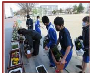
花いっぱい運動（港中）