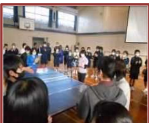
サウンドテーブルテニス体験（常磐中）