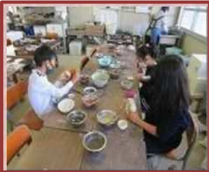
陶芸教室（八郷西小）