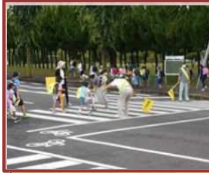
見守りボランティア（笹川小）