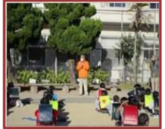
地域との防災学習（橋北小）