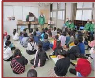
しろやま倶楽部活動（三重西小）