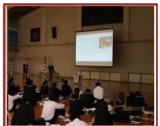
笹川地区郷土学習 (笹川中)

クラブ活動や、様々な教科の学習支援を行ってもらうことで、学力や人間力の向上に活かしています