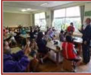
しめ縄づくり (小山田小)