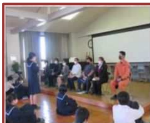
職業講話（富洲原中）