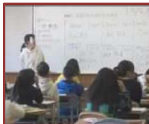
学習支援ボランティア (浜田小)