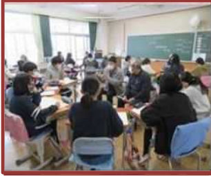
平和学習（中部西小）

学校・地域の協働した取り組みを通じて、地域づくりに貢献したり、人とのつながりを深めたりしています。