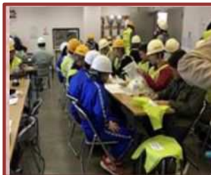
総合防災訓練（内部中）