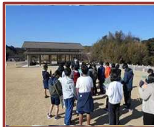
地域の名所めぐり (大矢知興譲小)