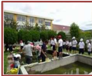
希望の池清掃（富洲原小）