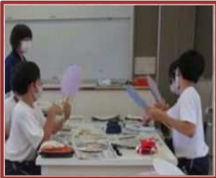
地域スペシャリスト授業（中部中）