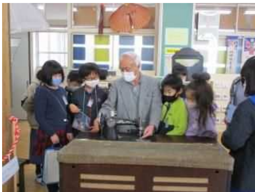
写真:「昔の暮らしの学習」八郷小