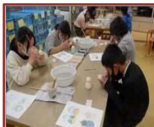
万古焼体験 (羽津小)