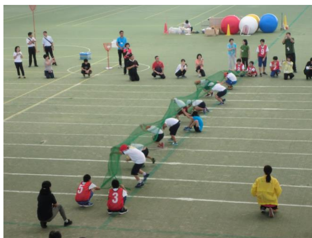
<令和元年度 三泗特別支援学級連合運動会>