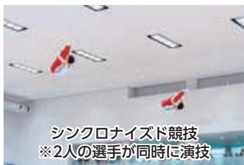
シンクロナイズド競技 ※2人の選手が同時に演技