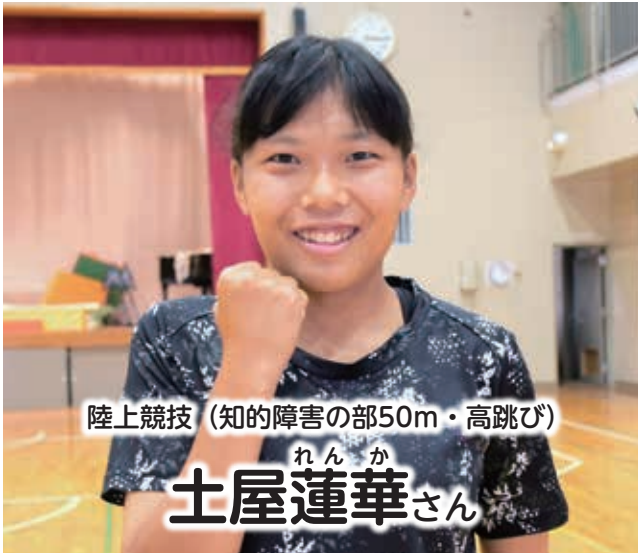
陸上競技 (知的障害の部50m・高跳び)