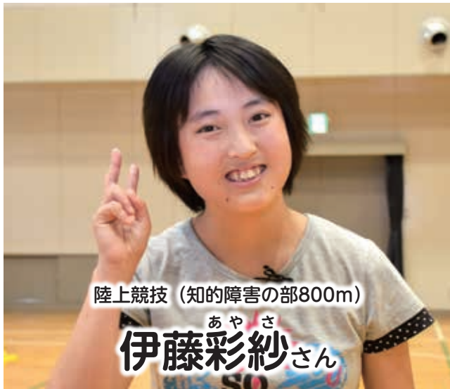
陸上競技 (知的障害の部800m)