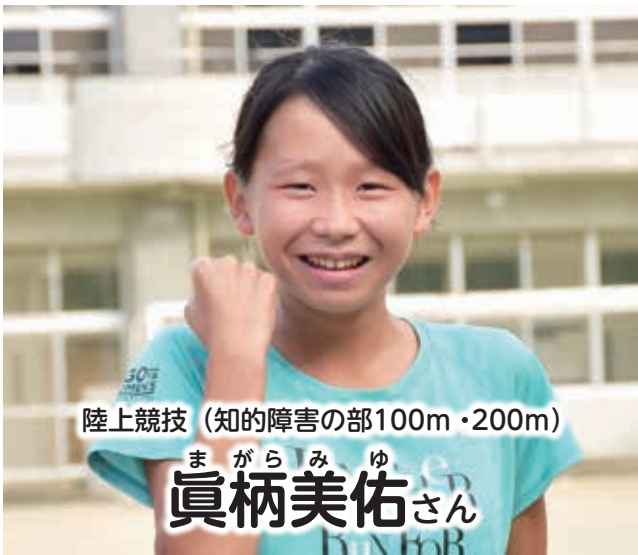
陸上競技 (知的障害の部100m・200m)

11月放送のCTY「ちゃんねるよっかいち」やCTY-FM「よっかいちわいわい人探訪」でも紹介します。(放送時間は裏表紙へ)