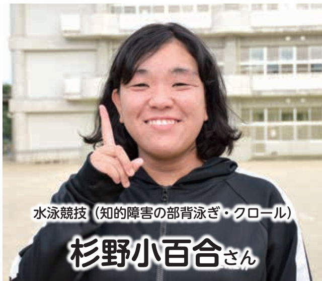
水泳競技 (知的障害の部背泳ぎ・クロール)

三重とこわか大会とは 障がいのある選手が競技等を通じ、スポーツの楽しさを体験するとともに、国民の障がいに対する理解を深め、障がい者の社会参加の推進に寄与することを目的とした障がい者スポーツの祭典です。